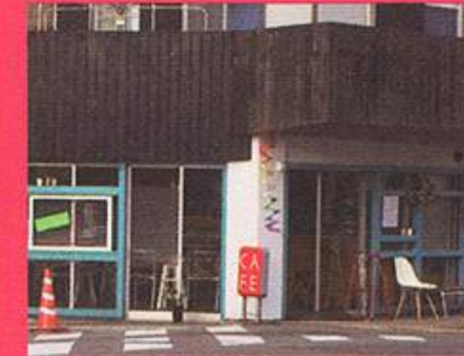
PEACE CAFE (カフェ)