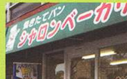
シャロンベーカリー (パン)