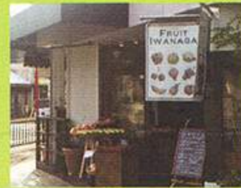
岩永青果 (フルーツ)